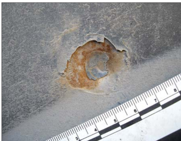
Рис. 1. Повреждение при выстреле из пистолета «Лидер» на наружной поверхности наружной панели двери легкового автомобиля «Додж-Калибер»

– на поверхности повреждения и вокруг него частиц резины, продуктов выстрела, порошинок не обнаружено.