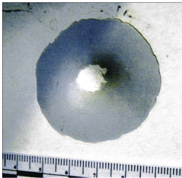
Рис. 2. Повреждение при выстреле из пистолета ПБ-4 «ОСА» на наружной поверхности двери водителя автобуса «ПАЗ». Выстрел под углом 90 градусов к плоскости двери

При экспертном исследовании двери автобуса «ПАЗ» были обнаружены два несквозных повреждения наружной металлической панели двери. Оба повреждения располагались в нижней части двери на одной мнимой горизонтальной линии и имели сходные морфологические признаки, представляющие собой конусовидные углубления с отслоением ЛКП в форме круга диаметром 50 мм, по центру которых имелись полусферические вмятины с сохранившимся в них фрагментом лакокрасочного покрытия. Микроскопическим исследованием на сохранившихся фрагментах ЛКП в центральных частях повреждений было установлено наличие на них микронаслоений резиноподобного вещества черного цвета (рис. 2).