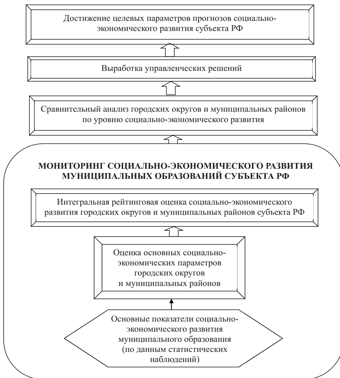
Рис. 1. Интегральная рейтинговая оценка как инструмент мониторинга социально-экономического развития муниципальных образований субъекта РФ

Кроме того, мониторинг социально-экономического развития муниципальных образований позволит регулярно контролировать степень достижения соответствующих целевых параметров, установленных документами стратегического развития региона и областными долгосрочными целевыми программами, и оценивать деятельность глав муниципальных образований с точки зрения эффективности принятых управленческих решений (рис. 1) [4].