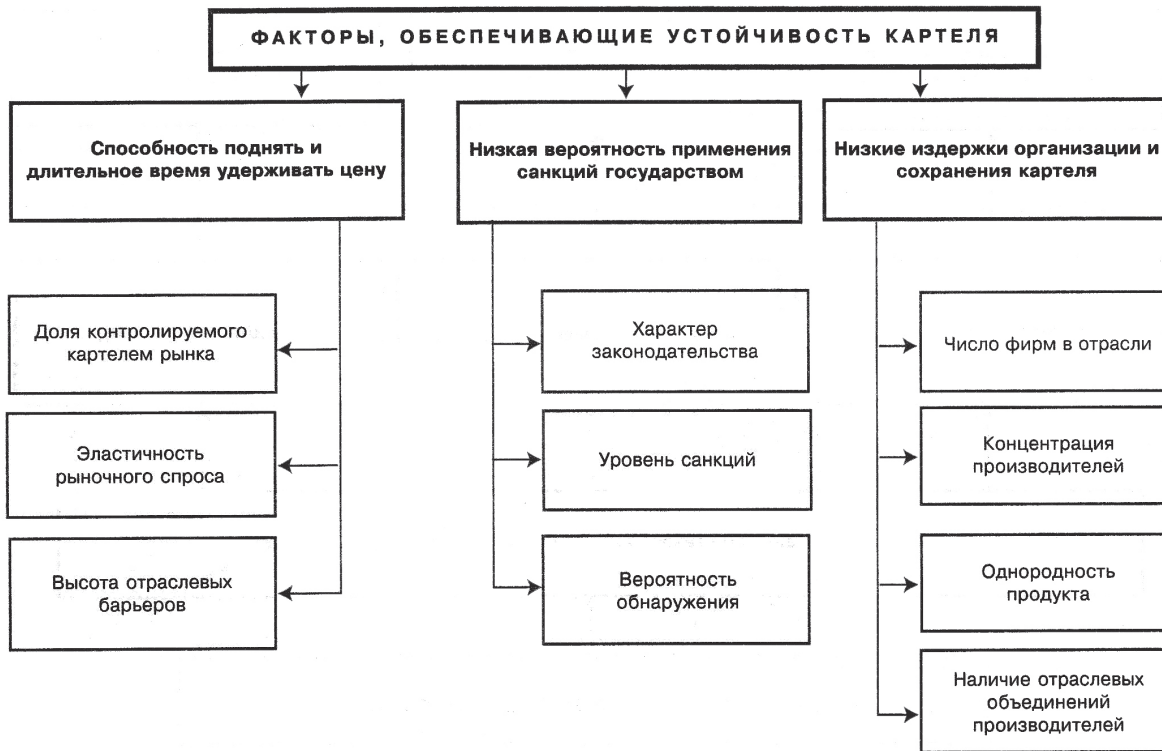
Рис. 2. Факторы, обеспечивающие устойчивость картеля 5

В условиях российской экономики картельные соглашения часто поощряются правительством, которое, например, официально поддерживает и регламентирует деятельность финансово-промышленных групп и других структур холдингового типа. Поэтому вряд ли должна удивлять возможность «расцвета» картелей в экономике России. Трансформирующаяся экономика характеризуется низкими издержками на организацию картеля.