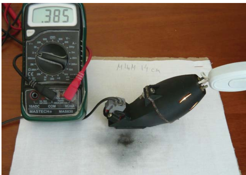
Фотометрирование внешней границы периферийной зоны отложения копоти

Для выявления внешних границ периферийных зон окопчения предварительно определялась средняя интенсивность света, отраженного чистой поверхностью ткани. Границей начала окопчения считались участки отложения копоти, на которых отраженный свет имел максимальную интенсивность, и в то же время доверительный интервал для ее среднего значения отличался с надежностью 95% от доверительного интервала средней интенсивности для чистой поверхности. Для обеспечения одинаковых условий замеров под фрагменты ткани подкладывался лист белой бумаги, что усреднило световой поток, отражаемый подложкой. Процесс фотометрирования показан на рисунке.